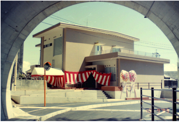
1989年10月9日 御豊瀬ふれあいセンターオープン当初