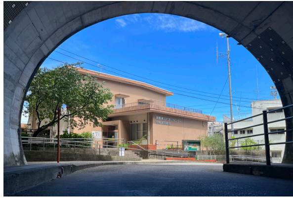
2022年5月 御豊瀬ふれあいセンター 高知市地域おこし協力隊着任当初