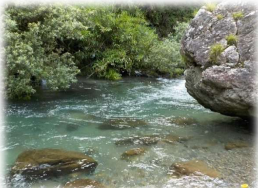
美しい鏡川上流の流れ