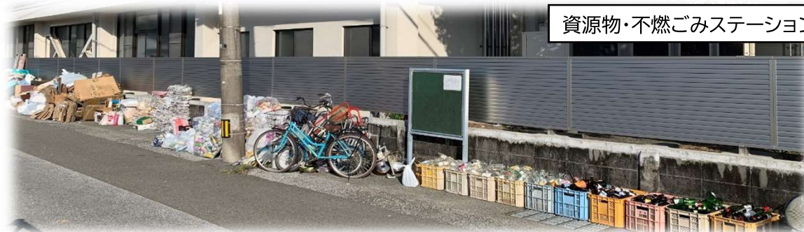
資源物・不燃ごみステーション

☑家庭から排出される資源物・不燃物を収集・運搬し、再資源化する事業に活用いたしました。