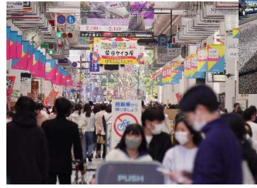
▲ 高知市のシンボル・鏡川 ◀ 中心部のアーケード街の様子

高知県のほぼ中央に位置する高知市は、人口約32万人の県庁所在地として、県内の政治・経済・文化の中心として発展してきました。市街地には行政機関や商業施設などが集まっていますが、車で30分も走れば、自然豊かな中山間地域や田園地域、油台な太平洋に面した沿岸地域があり、「都市部の便利さと、海・山・川のアクティビティが楽しめる」バランスの良いまちです。