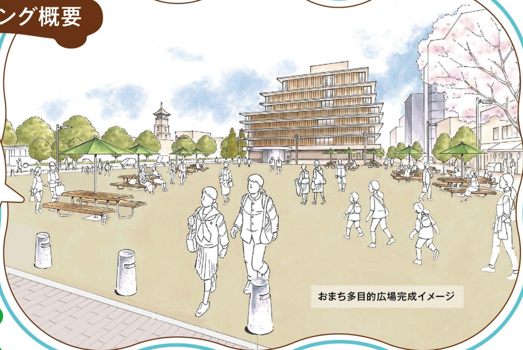
おまち多目的広場完成イメージ