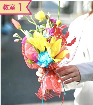
教室1 笑顔溢れる あんぱんブーケ♪ トモニフラワー 橋田智彰さん @tomoniflower