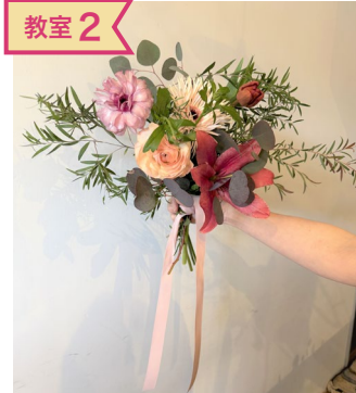
教室2 ゆりと春のお花で ナチュラルブーケ メグフローラルデザイン 葛目めぐみさん @megu_floral_design0901