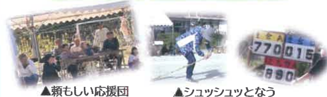
▲頼もしい応援団 ▲シュッシュツとなう

10月20日、第28回久重区民運動会が開催されました。優勝は大会史上初の1,000点越えを成し遂げた、重倉Bチーム。どの地区も老若男女、力を合わせて頑張りました。参加者からは「来年までに”縄ない”練習しよー！」という声も。期待しています！