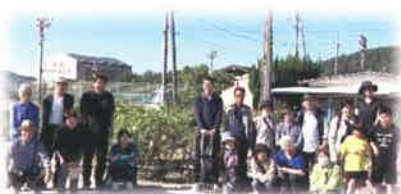
▲ようみバラ公園で集合写真

10月13日、今年も定員の20人でまったり気兼ねなくしまなみ海道を満喫してきました。歴史の重みを感じる大山祇神社、ようみバラ公園、瀬内海を一望する亀老山展望台を巡ってきました。体力的に一般のツアーには参加しづらくなった方からは、「こんな旅行は年寄りにはありがたい。来年も行きたい。」と期待を寄せていただきました。