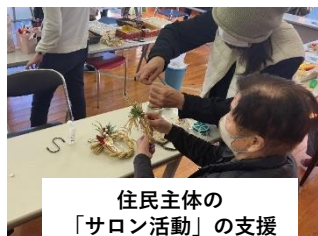
住民主体の「サロン活動」の支援