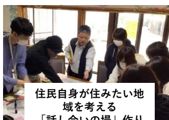
住民自身が住みたい地域を考える「話し合いの場」作り