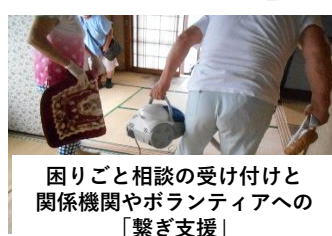
困りごと相談の受け付けと関係機関やボランティアへの「繋ぎ支援」