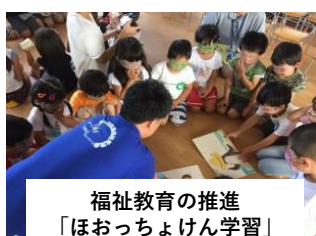
福祉教育の推進「ほおっちょけん学習」