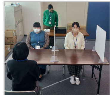
申請受付スペース