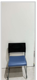
写真撮影スペース