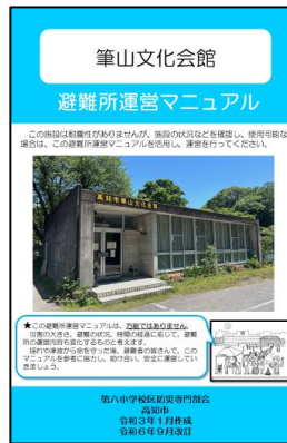
避難所運営マニュアル