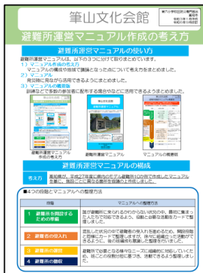
避難所運営マニュアル 作成の考え方