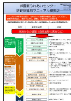
マニュアルの概要版