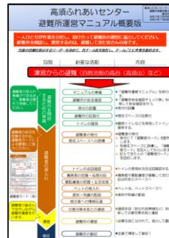
マニュアルの概要版