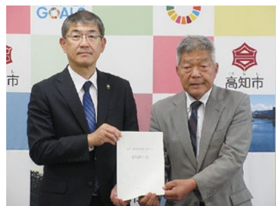
〈桑名市長から回答書を受け取る大野会長〉