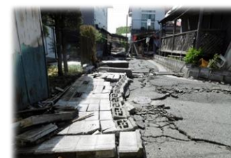
倒壊したブロック塀