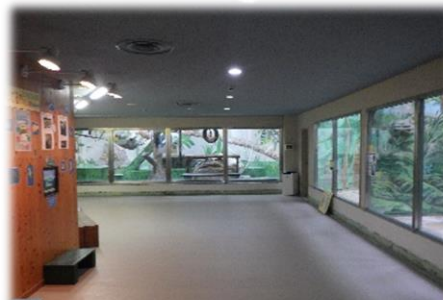
アニマルギャラリー内部（展示場）