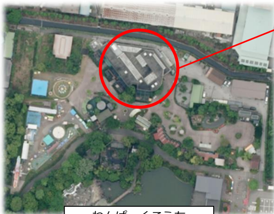
わんぱーくこうち

老朽化により使用不能となっている、わんぱーくこうち アニマルギャラリーの空調設備を更新します。