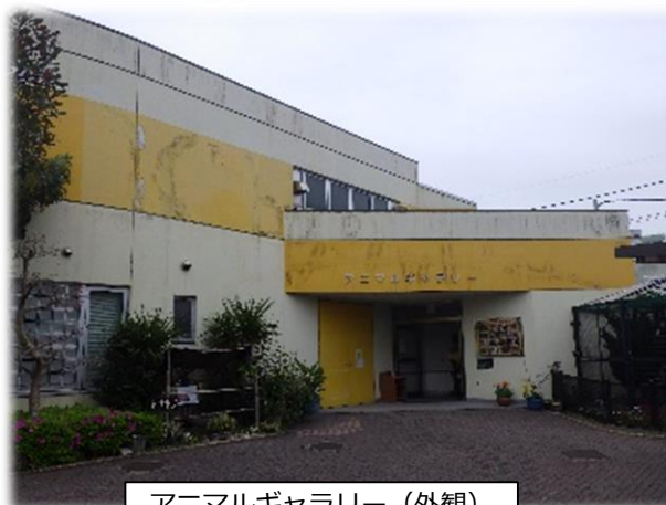
アニマルギャラリー（外観）