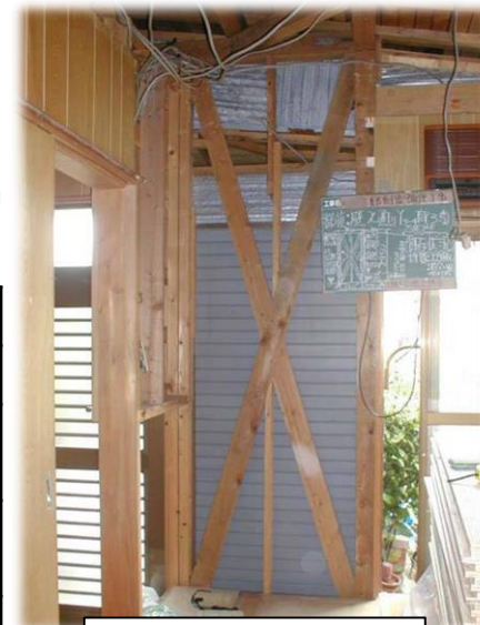
住宅耐震改修の様子