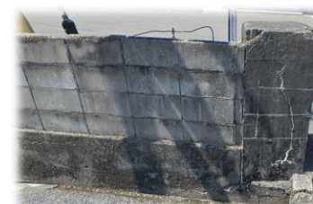
倒壊の危険性が高いブロック塀

避難路の確保や市街地の防災安全性を確保するため、災害時に倒壊等の危険性が高いコンクリートブロック塀等の撤去又は安全な塀等への改修補助22件の費用を増額します。