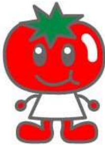
高知の食育8きょうだい トマトちゃん