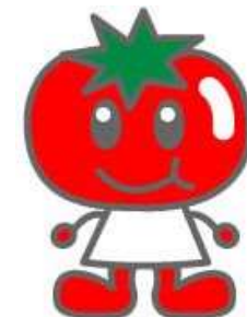
高知の食育8きょうだい トマトちゃん

★「高知市生活習慣病予防に関する協議会 所属団体」や「いきいき健康チャレンジ2017協力企業・団体」とコラボした様子を少しご紹介します。